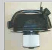
内部円筒 HEPA フィルタ