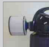
外部円筒 HEPA フィルタ